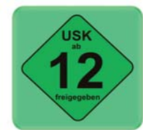
Freigegeben ab 12 Jahren