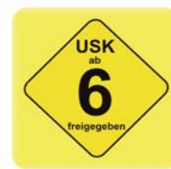
Freigegeben ab 6 Jahren