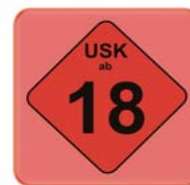
Freigegeben ab 18 Jahren