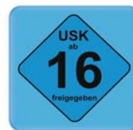
Freigegeben ab 16 Jahren